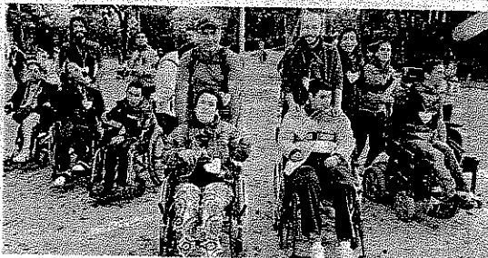
Los problemas físicos no fueron impedimento para participar en la marcha.